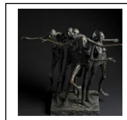
Les sculptures de l'artiste impressionnent...

Marc Petit, l'un des plus grands sculpteurs au monde, propose une de ses œuvres à l'une des plus petites communes au monde !!!